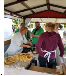
Damen beim Kaffeeverkauf.

Zusätzlich waren wir am Stand des leckeren Leine Pickert zu finden. Dort unterstützten wir tatkräftig die